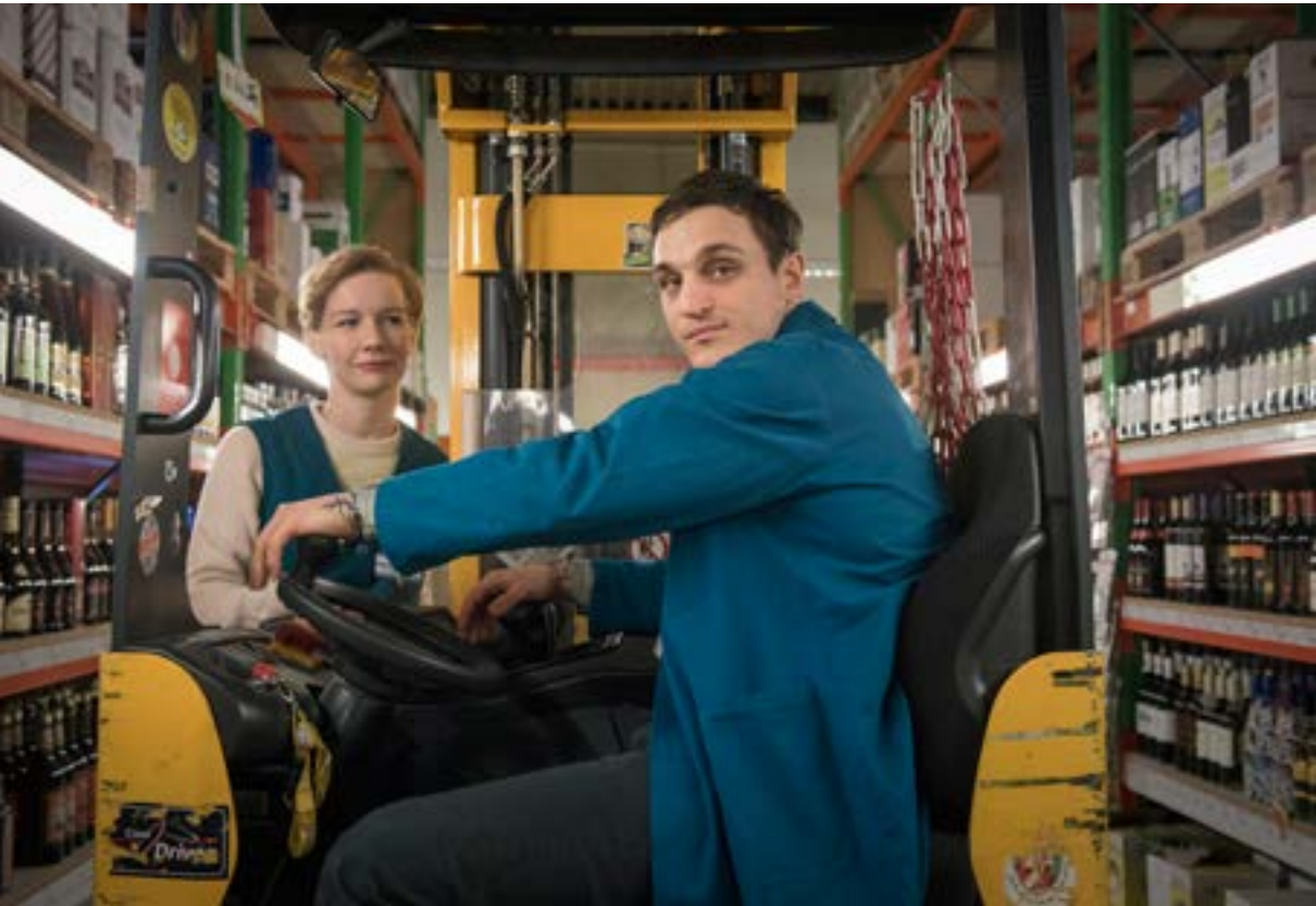
Christian (Franz Rogowski) und Marion (Sandra Hüller) in den Gängen im neuen Film von Thomas Stuber