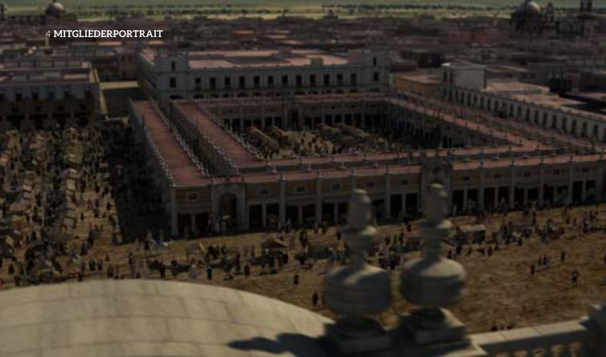
Für „El Baile de San Juan“ baute Falk Büttner Mexico City im Jahre 1791 nach.