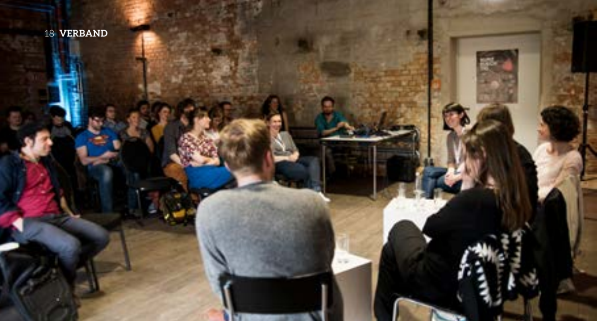
Die Gesprächsrunde fand als Teil des Rahmenprogramms des 14. KURZSUECHTIG im Kunstkraftwerk Leipzig statt.