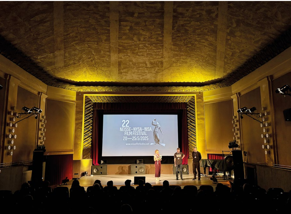
Das Kronenkino in Zittau ist das älteste original erhaltene Tonfilm-Lichtspieltheater Deutschlands und ein Spielort des Festivals