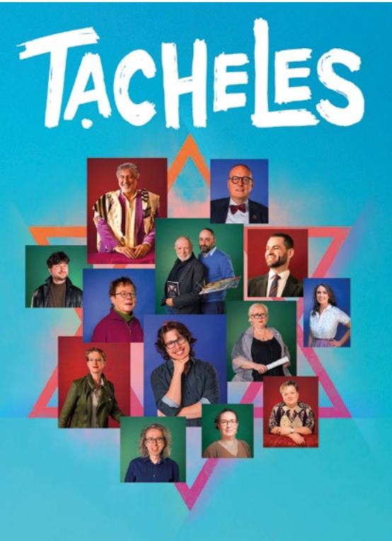
Key Visual von TACHELES - Jahr der jüdischen Kultur in Sachsen