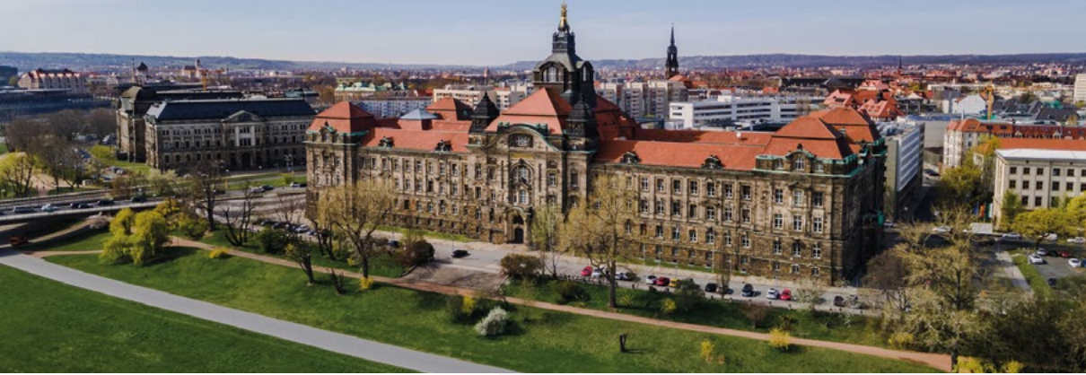
Die Sächsische Staatskanzlei in Dresden