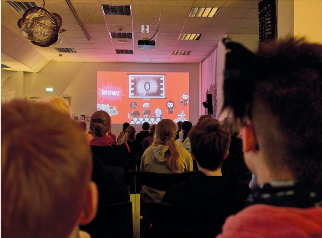
Die Kurz.Film.Scouts zu Gast im Chemnitz Open Space

Mit dem Projekt »Kurz.Film.Scouts« bringt das Filmfest Dresden junge Menschen in ländlichen Regionen erstmals in Kontakt mit internationaler Filmkultur und macht sie selbst zu Kurator*innen.