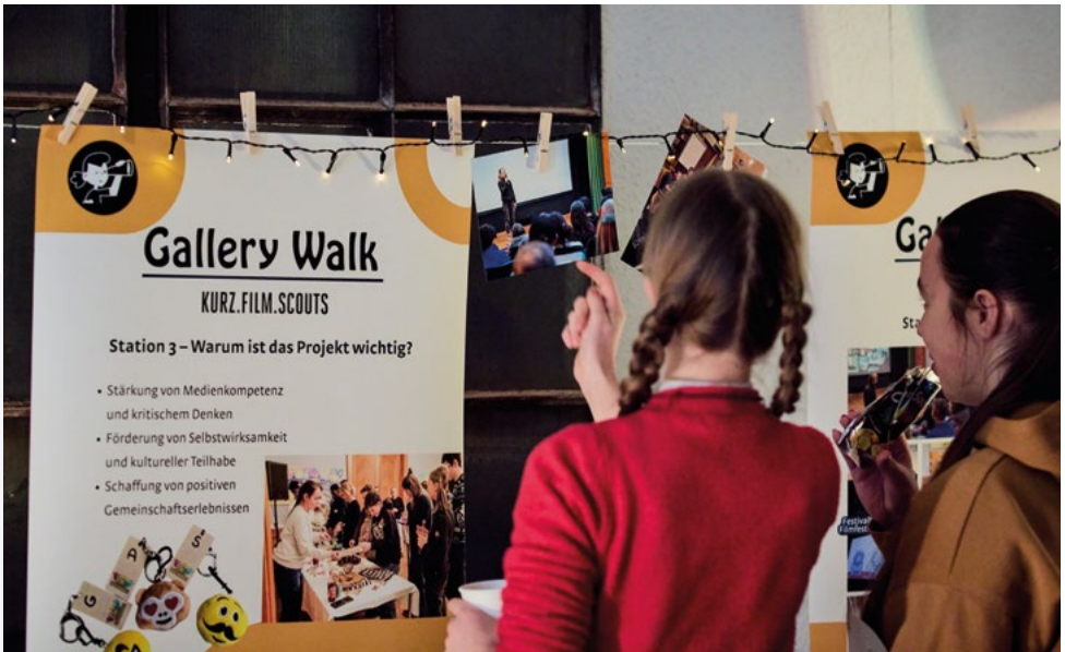
Der Gallery Walk bei der Kurzfilm-Challenge zum Kurzfilmtag

Schließlich lernen die Kinder und Jugendlichen in den dreitägigen Workshops nicht nur, Kurzfilme ästhetisch und inhaltlich einzuordnen und Programme dramaturgisch zu entwickeln, sondern auch, Filmgespräche zu moderieren und eigene Veranstaltungen zu organisieren. Am Ende des »Filmevents in Borna« gibt es dann für die sieben frischgebackenen Kurz.Film.Scouts ein Zertifikat und die Einladung zum Filmfest Dresden. Dort können die Teilnehmer*innen Festivalluft schnuppern und mit Filmschaffenden ins Gespräch kommen.