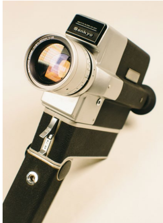
© unsplash.com / Girl with red hat

aufgehört. So wurden aus kreativen Ideen mit Verfolgungsjagden, Vogelperspektiven und Streitgesprächen dann doch immer wieder nur Amateurkurzfilme mit sehr wenigen Perspektiven.